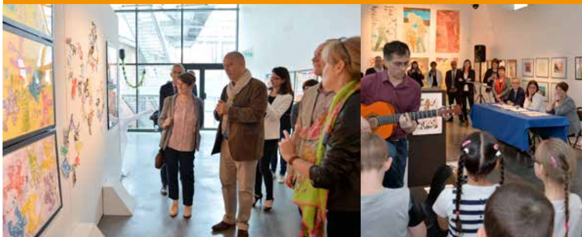
Daniel Rapaich / DICOM-Ville de Lille

Lille 2004 Capitale Européenne de la Culture se poursuit avec les manifestations de lille3000 qui propose d'explorer les richesses et les enjeux du monde de demain en invitant le plus grand nombre à la découverte des cultures et des artistes les plus contemporains. Les manifestations de lille 3000 se déploient sur l'ensemble du territoire. Avec de grandes expositions d'art contemporain, des installations artistiques dans la ville, des rendez-vous artistiques, lille3000 s'adresse à tous, et surtout à un public familial. Dans le cadre de la politique familiale de lille3000, tout enfant qui visite une exposition avec sa classe bénéficie d'une entrée gratuite pour pouvoir y retourner avec ses parents. L'aspect ludique et la médiation culturelle, au cœur de toutes leurs propositions, attirent un grand nombre de scolaires. Les thématiques proposées lors des diverses éditions sont alors exploitées avec enthousiasme par les enfants et leurs enseignants. L'exposition « Môm'art » en donne à chaque fois un bel aperçu.