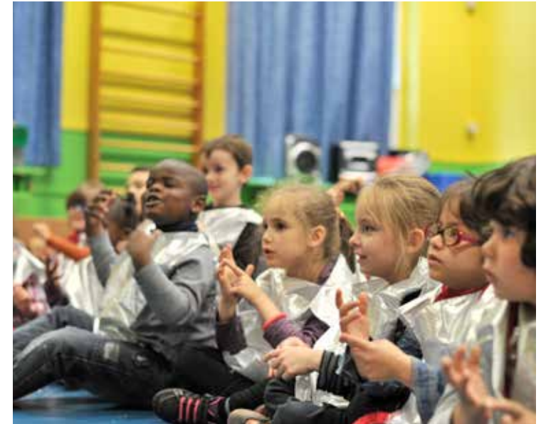
Julien Sylvestre / DICOM-Ville de Lille

Favoriser la réussite scolaire commence dès la petite enfance, où les inégalités pèsent déjà sur le destin scolaire des enfants. Des dispositifs innovants sont mis en œuvre dans les structures favorisant le langage et la socialisation des tout-petits. De trop nombreux enfants intérieo-