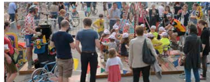
Daniel Rapaich / DICOM-Ville de Lille